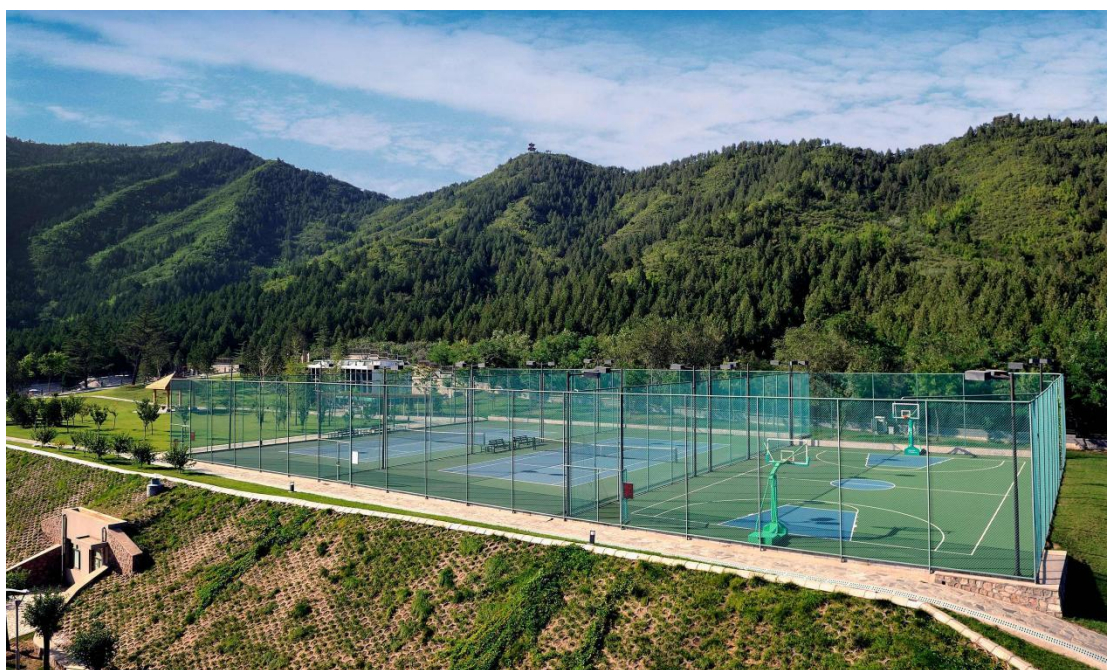
户外网球场、篮球场 供员工健身使用