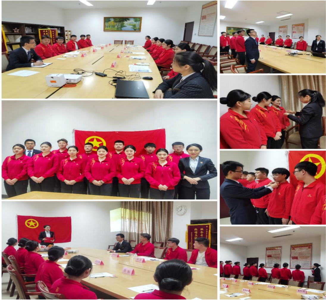
新员工入职培训及入团