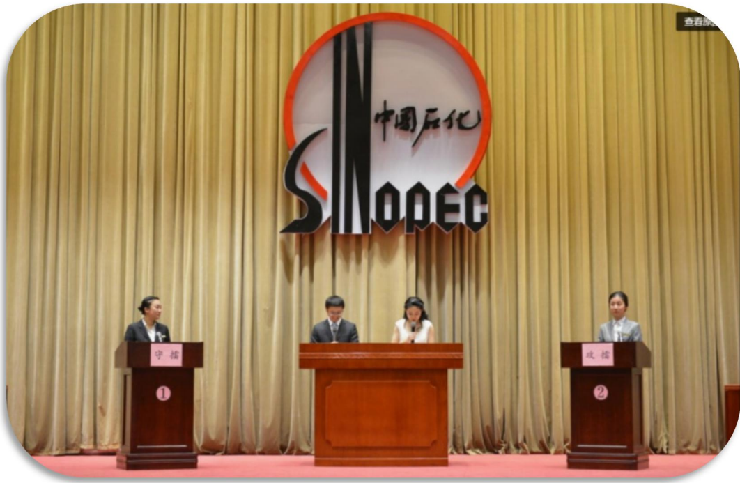
一战到底技能竞赛