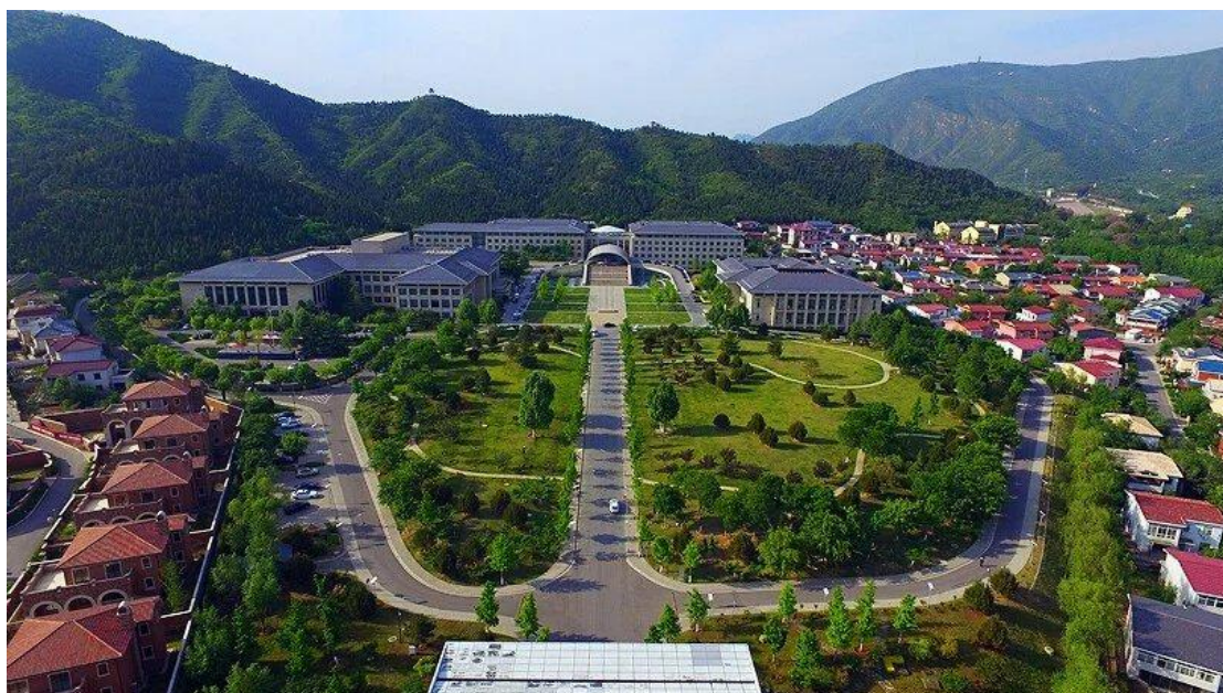
占地 12 万平方米